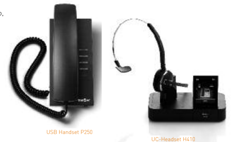
USB Handset P250